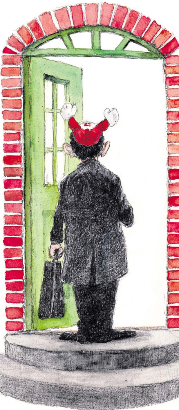
Tegning: Roald Als

»Ud fra en ortodoks betragtning vil koncentrationen omkring det centrale, nemlig bønnen til og forherligelsen af Gud, ikke kunne være optimal, hvis kvinder og mænd sidder sammen, står der på trossamfundets hjemmeside. Den jødiske menighed i Krystalgade er ortodoks, men forsøger også at være det favnende